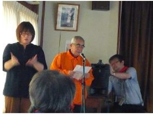
粕谷会館で開会宣言