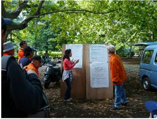
開始前のプログラム確認