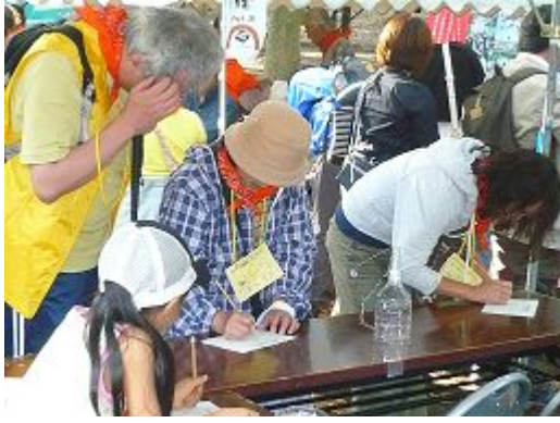
アンケートで参加賞ゲット