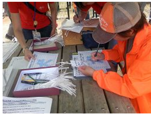
ペット避難の受付