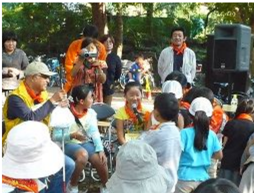
スタンプラリーも終わり意見交換