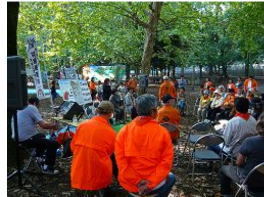
中越 語り部との座談会