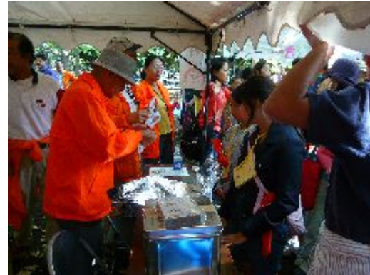
アルファ米の作り方