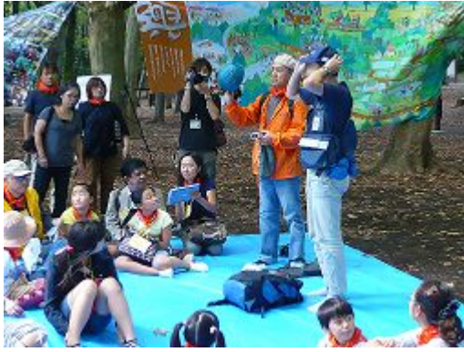
防砂グッズのチェック