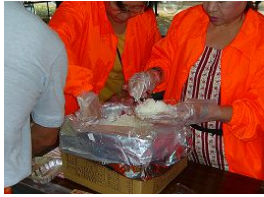
アルファー米の出来上がり