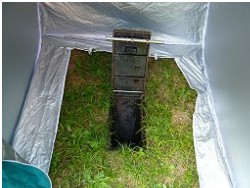
公園のマンホールトイレ