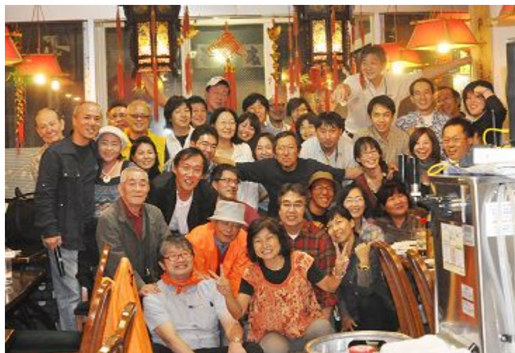
みなさん お疲れさま～