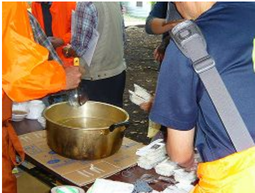
特に美味しかったケンチン汁