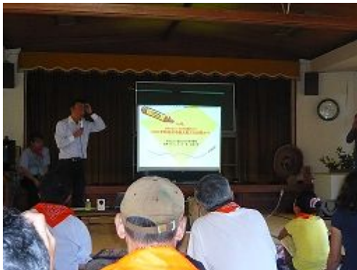
中越 被災・復興の話