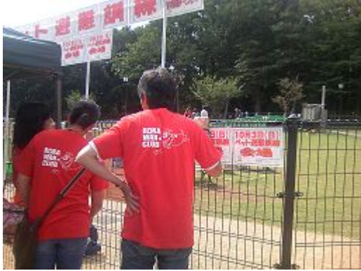
ペットの避難場所 (ドックラン)