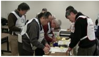
登録シートへの記入と登録カード受理