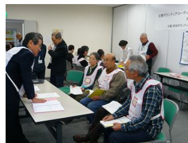
各ブースでの運営の説明