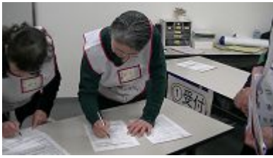
受付で、ボランティア保険の確認と登録シートの受け取り

午後の部では、参加者による運営とボランティアのグループに分かれ、午前中の勉強が生かされたか！？