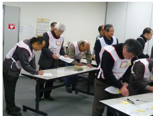
グループ分けは、赤と青のベストを着用