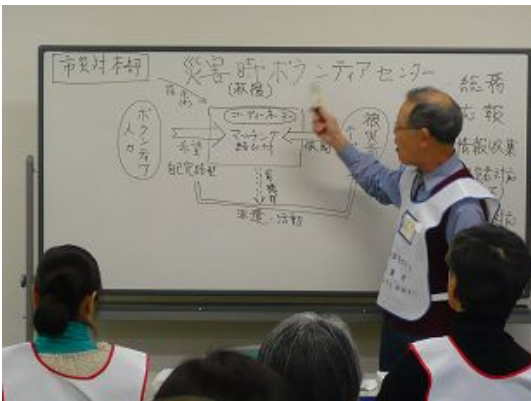
ボランティアセンターとは