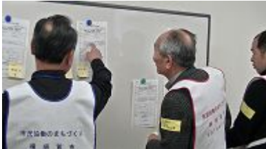
派遣先の選択とポスティング