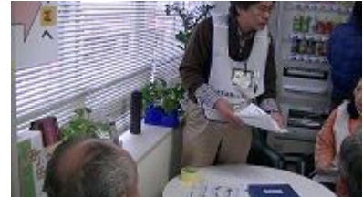
資機材の調達と返却