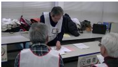
作業報告と引継ぎ