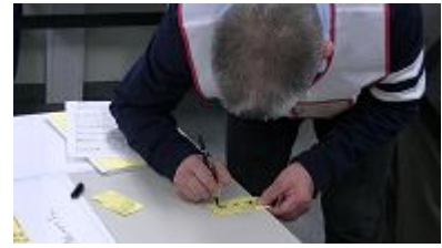
登録カードからワッペンの作成