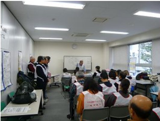
横須賀災害ボランティアネットワーク 本講座の説明

受付→登録→記載台→待機所→活動前のミーティング→マッチング→班編成・召集→ボランティアリーダー選出→資機材借用→活動→資機材返却活動後のミーティング→フォロー・ケア