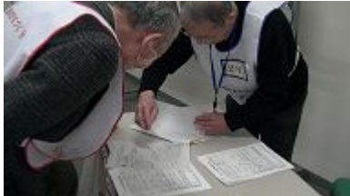
ボランティア派遣依頼票に基づき説明を受ける