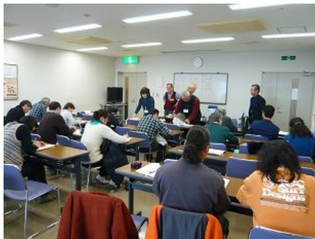
皆さん お疲れさまでした

ボランティアセンターの役割とボランティアとしての心構えを学ぶことができ、これで終わりとしなくて更なる訓練の積み重ねの必要性を感じました。 また、若い方の参加も期待したいところです。